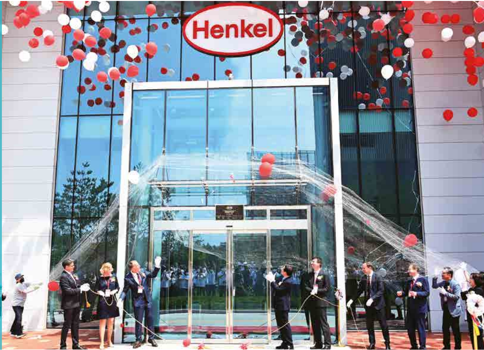
헨켈코리아, 첨단 전자재료 신사업장 준공