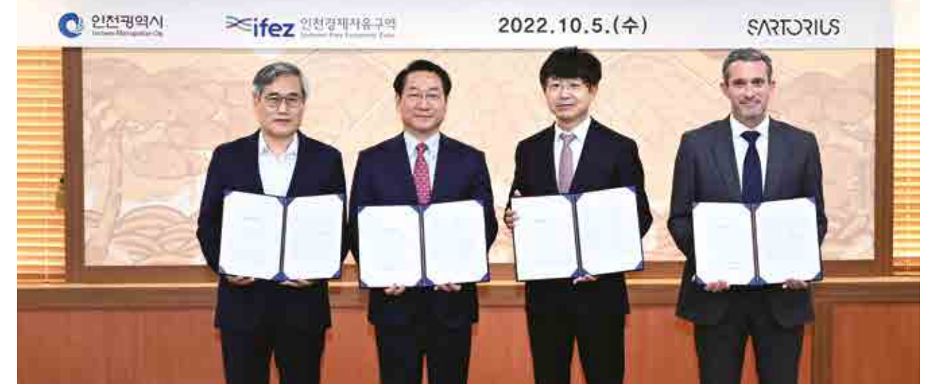
싸토리우스 투자계약 체결식