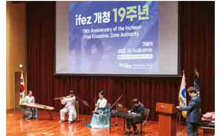
개청 19주년 행사 축하공연