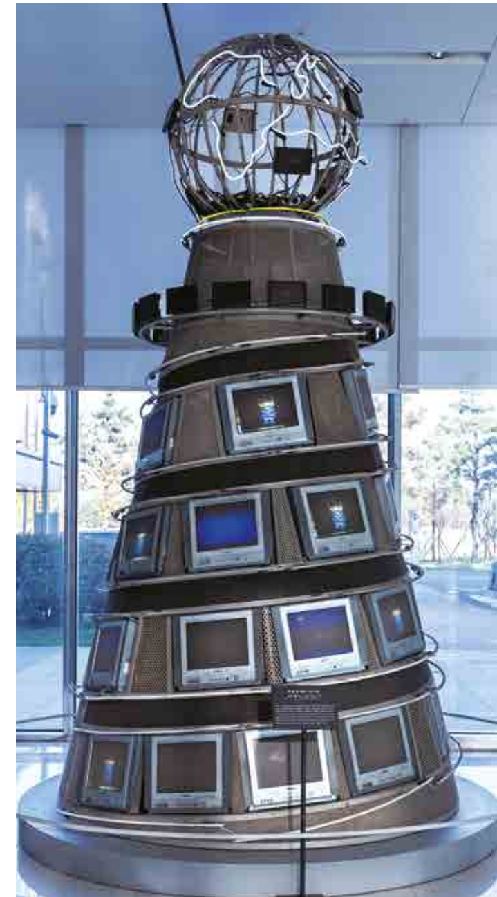
백남준 작가의 <Economic Super Highway> 작품