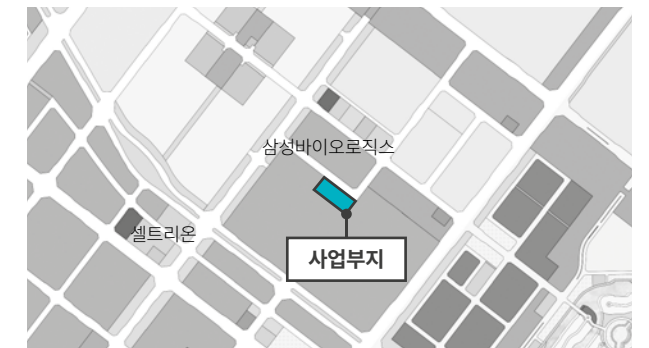
싸토리우스 건립 사업부지

한국에서는 싸토리우스코리아, 싸토리우스코리아바이오텍, 싸토리우스코리아오퍼레이션스를 운영 중이며, 이 중 싸토리우스 코리아오퍼레이션스가 송도 사업을 추진하고 있다.