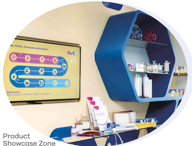
Product Showcase Zone

실제 공정에 사용되는 머크 제품을 전시해놓은 공간이다. 공정 개발, 최적화 및 스케일업을 위한 다양한 시도와 바이오공정 과정을 화면을 통해 체험할 수 있다.