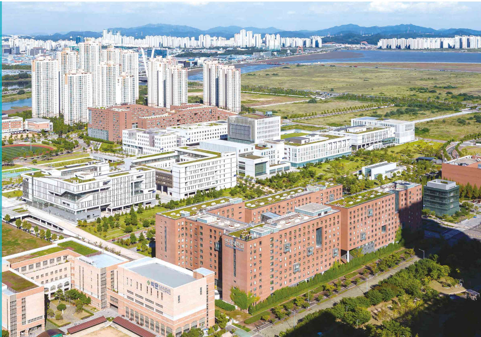
연세대학교 국제캠퍼스 전경

연세대학교 국제캠퍼스에 미래 국내외 제약바이오 산업을 이끌어갈 바이오공정 인력양성센터 실습교육센터가 개소했다. 오는 2024년 바이오공정 인력양성센터 개관에 앞서 한국형 나이버트(K-NIBRT) 프로그램을 실습 중심 교육을 수행한다.