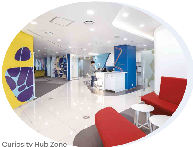
Curiosity Hub Zone

고객사가 방문했을 때 제약·바이오 기업들이 바이오 의약품 개발의 아이디어를 탐구하고, 혁신적인 기술을 배우며, 중요한 공정 개발 및 생산 문제를 해결할 수 있도록 돕는 협업 공간이다. 연구를 좀 더 효율적으로 진행하기 위해 기술 지원, 바이오 공정 컨설팅을 진행한다.