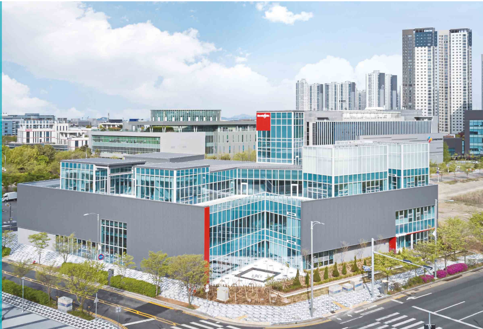
바이스트로닉코리아 사옥(인천광역시 연수구 인천타워대로 77)

설립일 2005년 8월 2일 규모 부지 3,360㎡, 연면적 4,294㎡