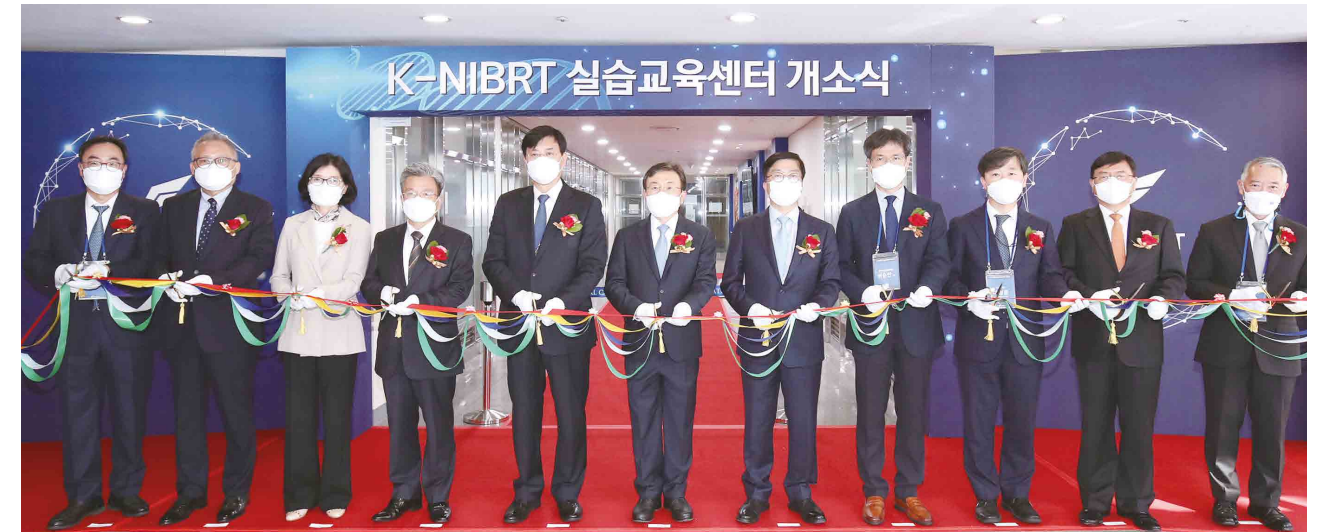
K-NIBRT 실습교육센터 개소식